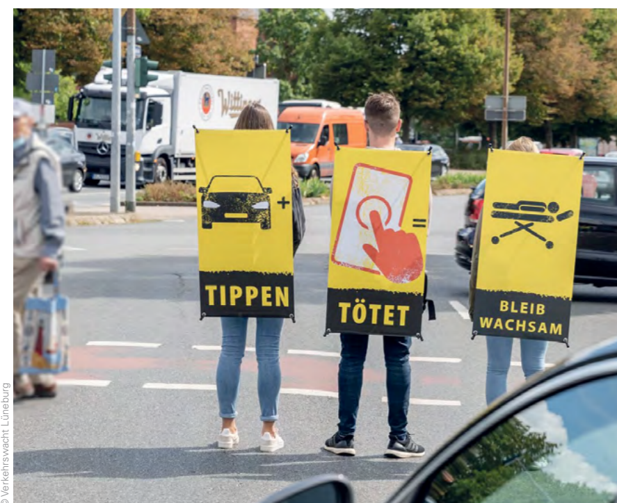
Mit einer Roadshow durch sieben niedersächsische Städte wird auf das Thema aufmerksam gemacht – wie hier in Lüneburg.