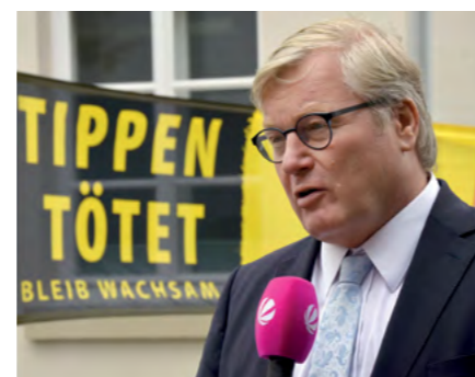
Dr. Bernd Althusmann