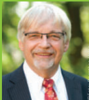
Rolf-Georg Köhler Oberbürgermeister Stadt Göttingen

Eine Kampagne des Klima-Bündnis Europäische Kommunen in Partnerschaft mit indigenen Völkern – für lokale Antworten auf den Klimawandel. klimabuendnis.org